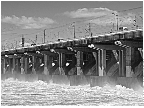
Половецье — один из самых напряженных периодов в работе ГЭС.

В соответствии с указаниями Федерального агентства водных ресурсов до 17 апреля среднесуточный расход воды гидроузла составлял 25000–25500 кубометров в секунду. Затем сброс начал ежедневно снижаться на 2000 кубометров в секунду, и к 22 апреля он выйдет на «рыбхозхозяйственную полку» (особый режим работы гидроузлов, который устанавливается, чтобы создать благоприятную обстановку для нереста рыбы) — 16000 кубометров в секунду. Продолжительность работы в этом режиме будет зависеть от гидрологической обстановки в мае. Отметим, что половецье — один из самых напряженных периодов в работе ГЭС. Это время повышенной нагрузки на гидротехнические сооружения, оборудование и персонал, который должен обеспечить безопасность и надежную работу оборудования. К началу весеннего половодья после капитального ремонта на Волжской ГЭС введен в работу гидроагрегат № 7 установленной мощностью 115 МВт. До конца 2020 года гидроэнергетики выполнят капитальный ремонт четырех и текущий ремонт всех агрегатов.